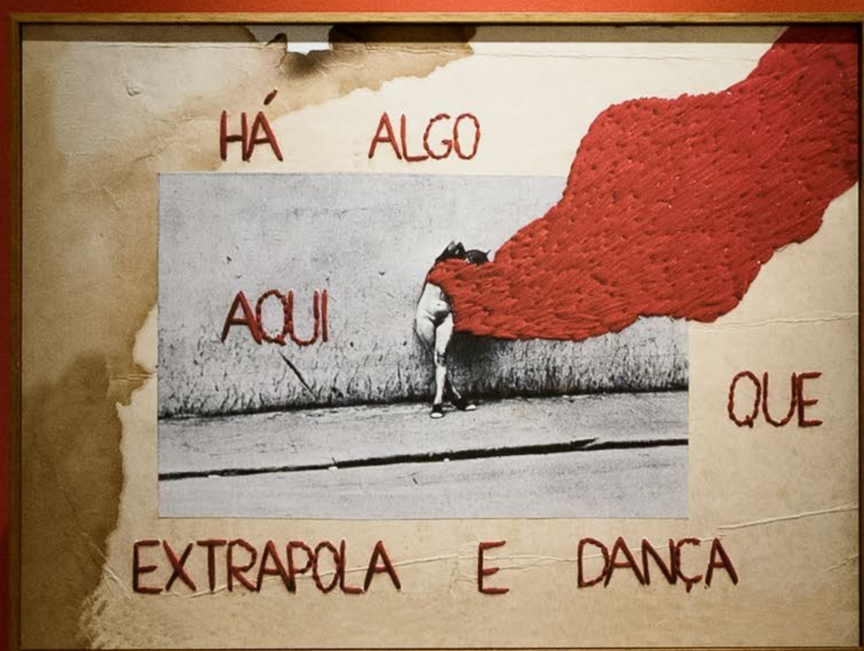
Hélio Oiticica Extrapola e dança, 1967 Bordado sobre colagem Cemitério de São João de Deus